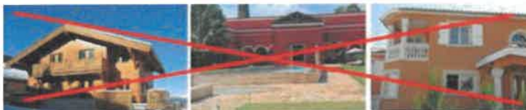
Illustration de constructions d'aspects non adaptés à la région ou néoclassiques